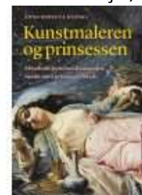
KUNSTMALEREN OG PRINSESSEN

( http://www.historie-online.dk/boger/anmeldelser-5-5/lokal-og-slaegtshistorie/vejle-i-kunsten-kunsten-i-vejle )