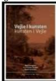
VEJLE I KUNSTEN - KUNSTEN I VEJLE

( http://www.historie-online.dk/boger/anmeldelser-5-5/kunst-arkitektur-haver-design-mode/snit-industrialismens-toej-i-danmark )