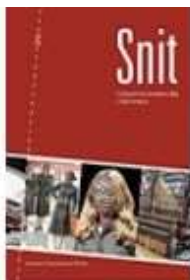
SNIT - INDUSTRIALISMENS TØJ I DANMARK

( http://www.historie-online.dk/boger/anmeldelser-5-5/kunst-arkitektur-haver-design-mode/snit-industrialismens-toej-i-danmark )