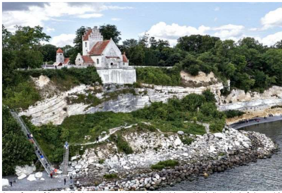
Dronefotoet af Stevns Klint iscenesætter Højerup Gamle Kirkes unikke beliggenhed på dramatisk vis. Efter at koret styrtede i havet i 1928, blev den betonsikring, der i dag bærer udsigtsterrassen, støbt. Herved blev nedbrydningen standset, og havet spiser ikke længere kirken bid for bid.

Tallene viser, at Trap Danmark har prioriteret kulturen som et af fundamentene i en danmarksbeskrivelse. Det gør det også nemmere at forholde sig til indholdet i kapitlerne om kultur, at de er bygget nogenlunde ens op. Indholdet i disse kapitler er rimeligt, og vi får god besked fx om kulturhistoriske museer, religion og trossamfund, byggeskik på landet, billedkunst og musik. Undertiden bliver det lidt for summarisk, når det nævnes, at "Ringsted Kulturhus danner ramme om en række foreninger" (s.113), men vi får ikke besked om, hvilke foreninger det drejer sig om. Det skal sættes i relation til, at idrætsforeningerne omtales mere specifikt. Her nøjes man ikke med at skrive, at "Idrætsforeningerne har stor tilslutning i Ringsted Kommune". Nej, her skal vi fx vide, at "Benløse Idrætsforening (oprettet 1934) topper listen, mens Ringsted Idrætsforening (oprettet 1890) er delt op i mange mindre foreninger, bl.a. gymnastik og fodbold, der tilsammen har mange medlemmer. Også Ringsted Svømmeklub er meget søgt". Selv om det også er summarisk, er det alligevel et lidt mere nuanceret billede, end tilfældet er for foreningernes vedkommende. Det er nok en lille detalje, og den skal ikke skygge for, at kulturafsnittene gennemgående er oplysende, interessante og væsentlige.