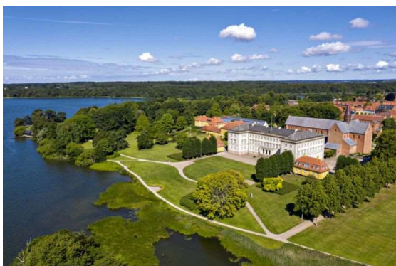
Sorø Akademi's hovedbygning og Akademihaven ligger direkte ned til Sorø Sø. Bygningen er opført i årene 1822-27 og er tegnet af Peder Malling. Den officielle indgang er fra sassen. Bag hovedbygningen ses bl.a. Sorø Klosterkirke fra middelalderen.

Det siger sig selv, at Sorø Kloster og Sorø Akademi er væsentlige emner i begge udgaver. På samme måde, som det var tilfældet med den animalske produktion, gælder det også om disse vigtige institutioner, at 5. udgave var tyngt af et hav af uvæsentlige detaljer. Det betød, at det var svært at holde fokus på det væsentlige. Mange afsnit, der var sat med en meget lidt læsevenlig skriftstørrelse og de meget lange afsnit, gjorde det bestemt ikke nemmere. En sand mani for forkortelser bidrog også hertil. Hvor befriende er det at læse 6. udgave, hvor vi på blot fire sider får god besked om klostrets historie, klosterbygningerne, Sorø Akademi, dets bygninger og Akademihaven. Vi kan samtidig glæde os over de gode fotos.