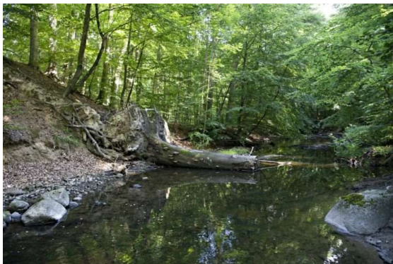
Hvor Køge Å passerer tæt forbi Lellinge, findes en grågrønlig bjergart i ådalens bund. Den kaldes Lellinge Grønsand. Om sommeren, når den har lavere vandstand, kan man samle fossiler fra åbunden. De er enten indlejret i Lellinge Grønsandskalk eller i mere sandet og leret materiale.

Ligesom Trap Danmark har struktureret fremstillingen af kommunerne på samme måde, gælder det samme også fremstillingen af de forskellige afsnit, som bogen er bygget op om. Er man fx interesseret i naturen og landskabet eller historie, er det nemt at finde de oplysninger, man er interesseret i. I afsnittet om naturen og landskabet får vi fx god besked om det varierede landskab i Sorø Kommune, om natur- og landskabsforvaltningen, friluftslivet, beskyttede områder, særlige biller, svampe og fugle og om Naturpark Åmosen, der i 2014 blev etableret som Danmarks første naturpark. På samme måde er naturen beskrevet for de andre kommuner. Det giver lyst til at gå på opdagelse i naturen og opsøge alle herlighederne. Alligevel undrer det mig, at debatten om den vilde naturs tilstand overhovedet ikke er berørt. Forskere fra Aarhus Universitet har samlet og evalueret data fra overvågning af den danske natur de seneste ti år, og konklusionen var, at biodiversiteten var i tilbagegang, og derfor er mange dyr og planter truede. Er emnet for kontroversielt? På samme måde er en diskussion om landbrugets problemer og om økologi heller ikke berørt. Burde der ikke være plads til forskellige synspunkter?