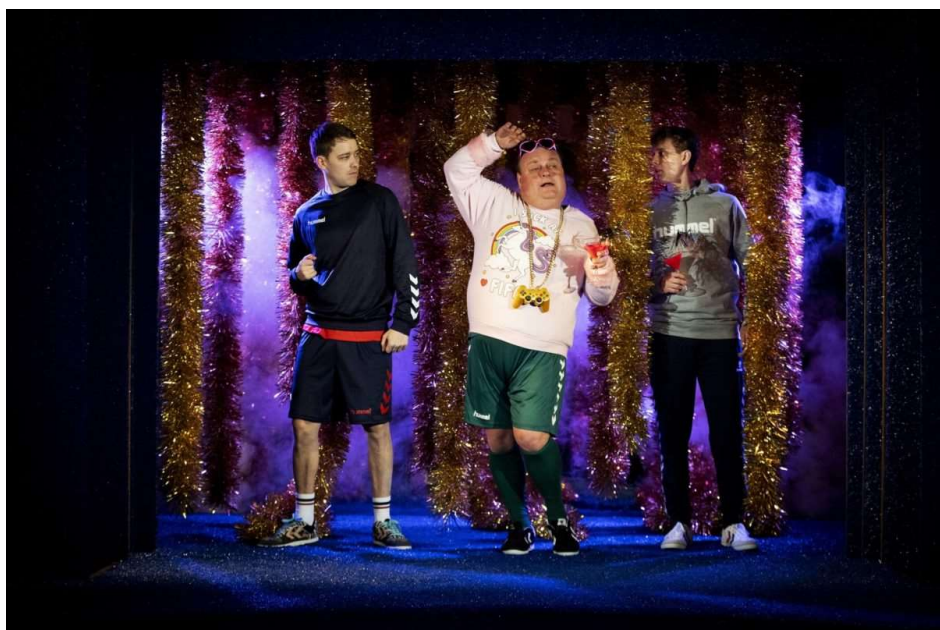
Offside på Folketeatret.