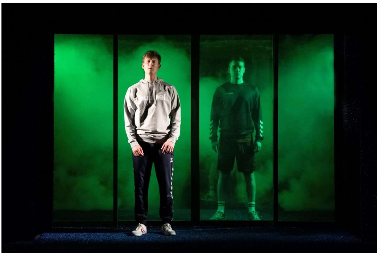
Offside på Folketeatret.