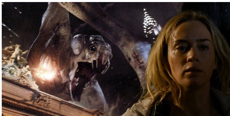
Et af monstrene fra A Quiet Place.

Ikke engang da familien familiens mindste barn bliver spist lige for øjnene af dem, kan forældrene tillade sig at udbryde det mindste pip af sorg. Skriger de, græder de, råber de – så vil de andre børn også blive taget. Til sammenligning ryger de karakteristiske bind for øjnene i Biers film af og på i et væk alt efter, hvordan det lige passer med manuskriptforfatterens luner.