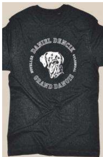
(/boeger/grand-danois) GRAND DANOIS (/BOEGER/GRAND-DANOIS) Af Daniel Dencik