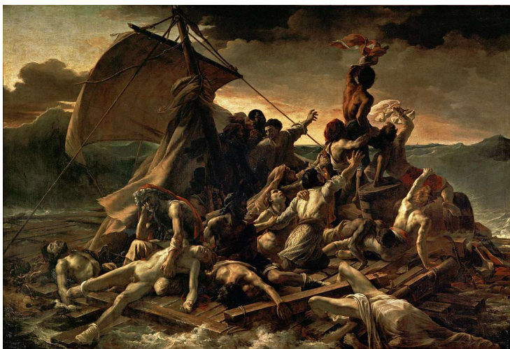
Théodore Géricaults 'Le Radeau de La Méduse' hænger på Louvre