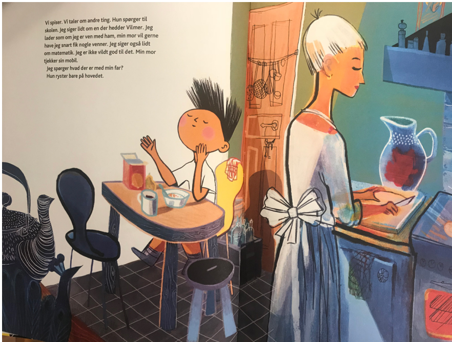
Van Gogh møder Mary Blair i skøn forening.