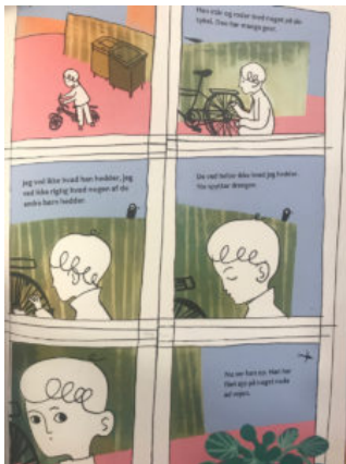
Da Robin ser Aksel gennem vinduet.

Faren ringer, han vil gerne komme på besøg. Mens Robin sidder i vindueskarmen og venter på ham, kigger han på de legende børn i gården. Især en fanger hans øje, en dreng der roder med sin cykel. I en eminent sekvens zoomer Dam billede for billede ind på drengen, mens flere og flere detaljer kommer på. I den næstsidste rude kigger han direkte på Robin (og os), og i det sidste er han væk – tilbage er en enlig svale og fokus er på potteplanten i vinduet.