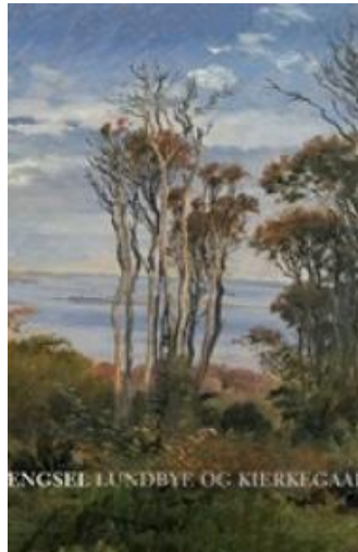
(/boeger/laengsel-lundbye-og-kierkegaard) LÆNGSEL - LUNDBYE OG KIERKEGAARD (/BOEGER/LAENGSEL-LUNDBYE-OG-KIERKEGAARD) Af Hans Edvard Nørregård-Nielsen, Bente Bramming & Ettore Rocca