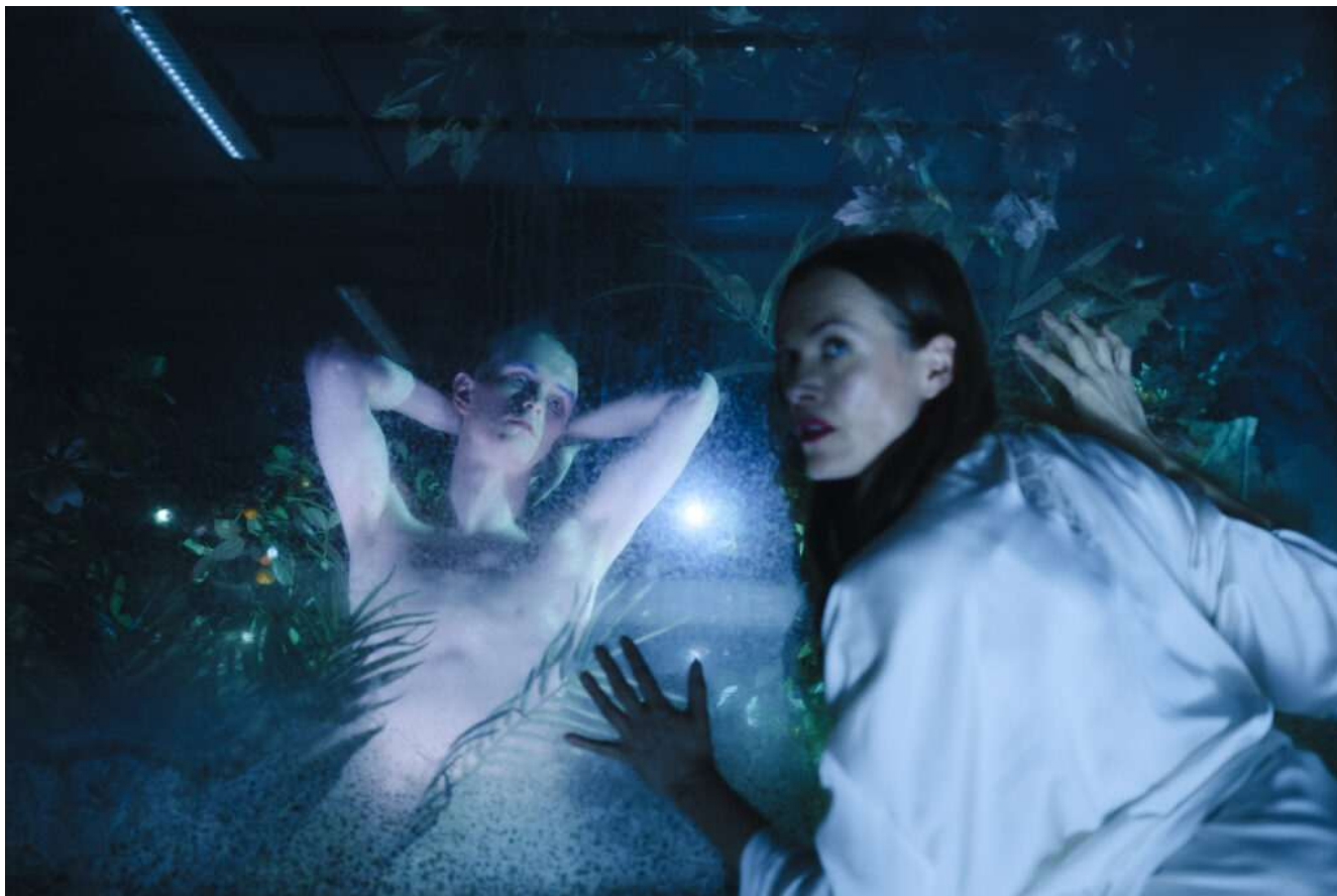
Traum, Aarhus Teater.

LÆS OGSÅ: ISCENEs anmeldelse af A Clockwork Orange på Aarhus Teater