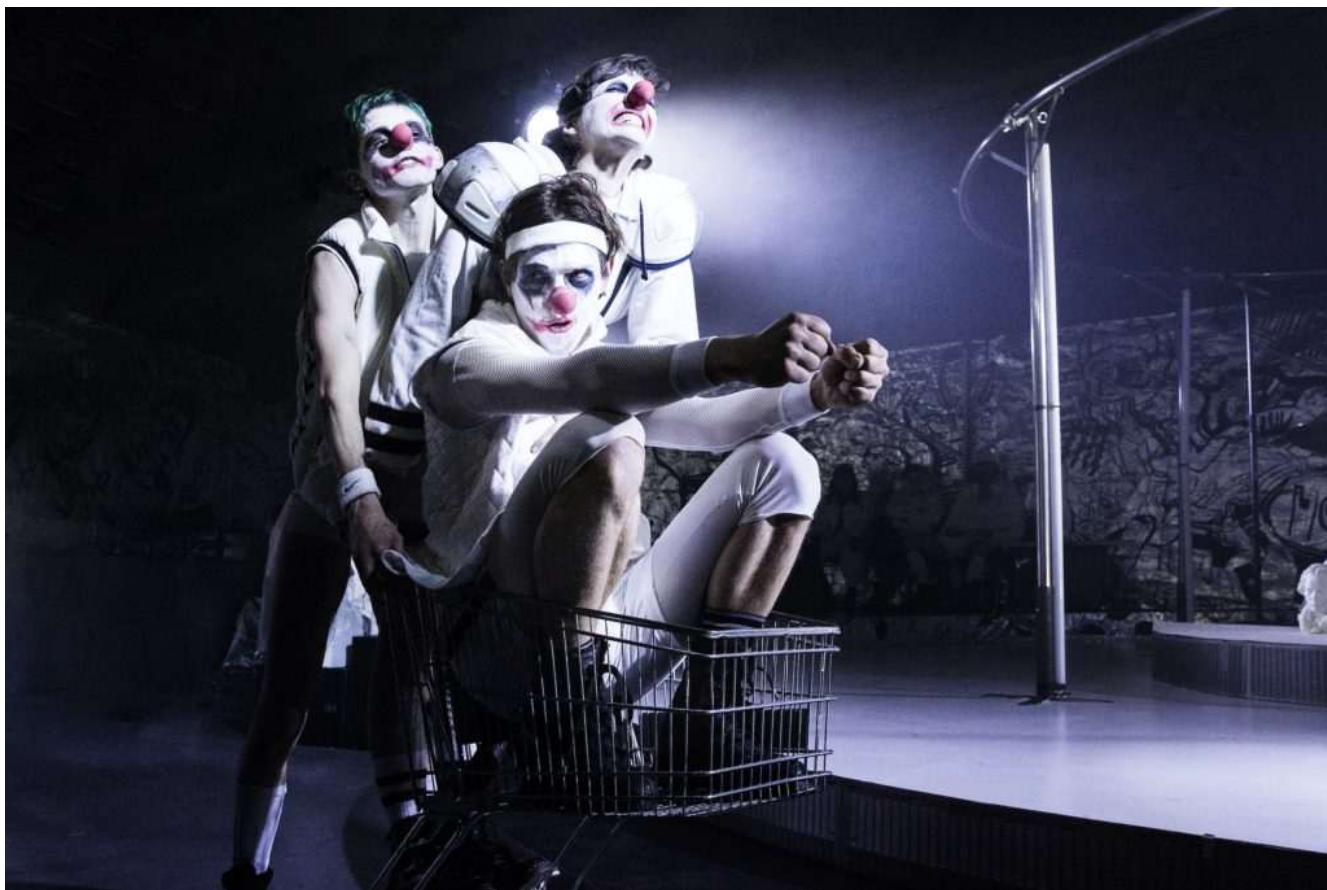
A Clockwork Orange, Aarhus Teater.