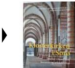
KLOSTERKIRKEN I SORØ

( https://www.historie-online.dk/boger/anmeldelser-5-5/kirke-og-religion/klosterkirken-i-soroe )