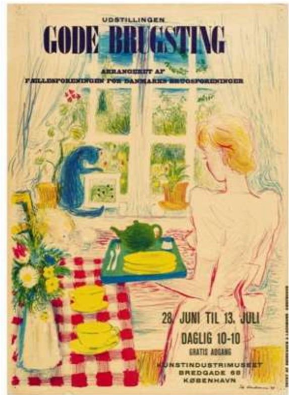
Tv. FDB forside fra Uddelerbladet som 1944 omtaler Børge Mogensen designermøbler. Th. Plakaten for den centrale FDB-udstilling "Gode Brugsting" på Kunstindustrimuseet 1941.