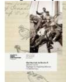
KLAR BLAA LUFT, LET BRIS FRA N.

( https://www.historie-online.dk/boger/jens-juel )