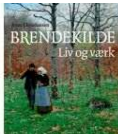
BREDEKILDE - LIV OG VÆRK

( https://www.historie-online.dk/boger/aebler-i-danmark )