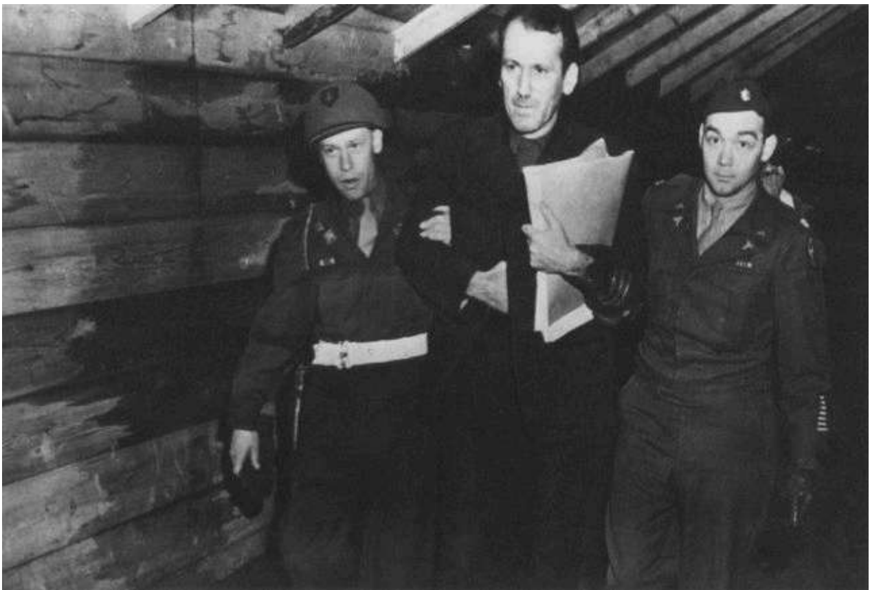
Den engang så mægtige chef for Sikkerhedstjenesten eskorteres til retssalen under Nürnberg processen.

Vi får historien om "De hvide busser" og deres utrolige indsats i krigens sidste dage. Og de sidehistorier de trækker med sig. Blandt andet Heinrich Himmlers desperate forsøg på at redde sit skind. Som en ud af mange. Herunder chefen for SD, Ernst Kaltenbrunner. Han frygtede virkelig at ende i galgen. Hvortil må siges: det var dér, han endte i oktober 1946.