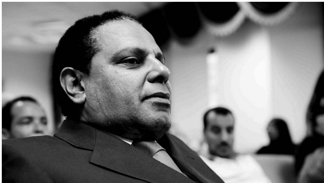
Alaa al-Aswany er en af de mest læste forfattere i Mellemøsten. Men forfatteren selv er ikke velkommen.