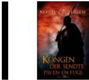
KONGEN DER SENDTE PAVEN EN FUGL