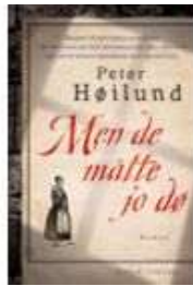
MEN DE MÅTTE JO DØ