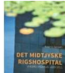
DET MIDTJYSKE RIGSHOSPITAL