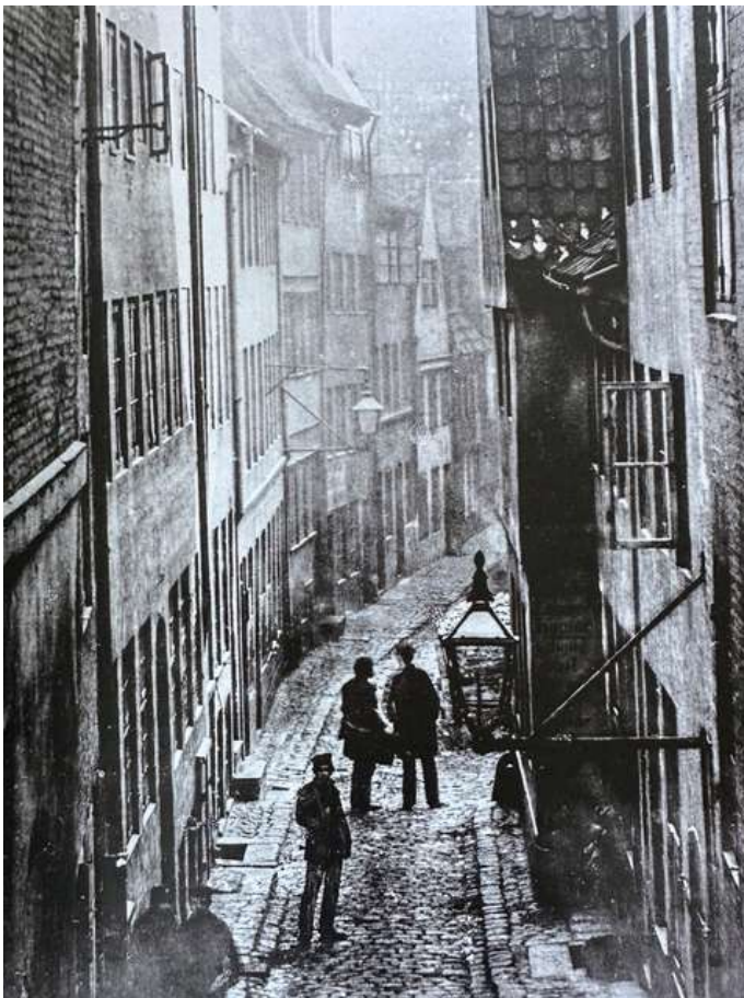
Peter Madsens Gang ca 1870. Gangen var under tre meter bred på det smalleste sted. Et råb kunne tydeligt høres i husene

På den tid, hvor årstallet skifter til 1800, var København en farlig, overbefolket, stinkende by. Rendestene og snavsede borgere blandede sig mellem bedsteborgere og alskens handlende. Det skabte sit helt eget lydbillede. Hunde glammede og køer brølede, og skovserkoner og fiskekoner råbte om kap med eder og forbandelser. De åbne steder, der var skabt som brandbælter efter den store brand, gav valbykonernes råb en særlig akustik. Ved Københavns porte var der en helt særlig kulisse af støj. Råb, vrinsk, brøleri, vogne der rumlede og piskeslag fra kuskene.