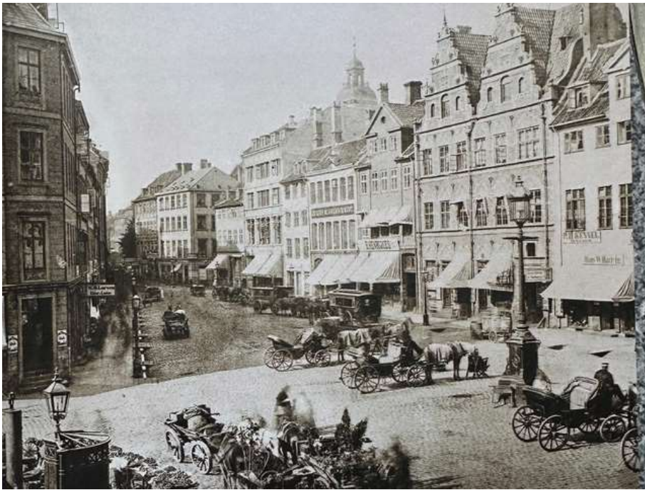
Fra de første omnibusser i 1841 var Amagertorv et centralt stoppe- og vendested. Her i 1867 med drosker og omnibusser parkeret ved den store gaslygte fra 1857

På den tid, hvor årstallet skifter til 1800, var København en farlig, overbefolket, stinkende by. Rendestene og snavsede borgere blandede sig mellem bedsteborgere og alskens handlende. Det skabte sit helt eget lydbillede. Hunde glammede og køer brølede, og skovserkoner og fiskekoner råbte om kap med eder og forbandelser. De åbne steder, der var skabt som brandbælter efter den store brand, gav valbykonernes råb en særlig akustik. Ved Københavns porte var der en helt særlig kulisse af støj. Råb, vrinsk, brøleri, vogne der rumlede og piskeslag fra kuskene.