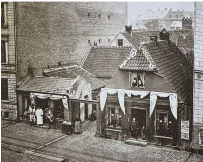
Vesterbrogade 70 i 1880. De gamle slagtergårde var omringet af nye etageejendomme i fem etager. Ved porten står en amagerkone og sælger hvidkål

De mange nye virksomheder med hylende fabriksfløjter, drevet af damp, bliver et nyt irritationsmoment for københavnernes. Dampkraften blev udnyttet, og meget lidt gennemtænkt var boliger og industri blandet sammen. Der kom også mange nye maskiner til som boremaskiner, drejebænke og ikke mindst væverier, der med remtrukne maskiner larmede. Faktisk larmede alt det nye, så utallige mistede hørelsen. Det var endnu et ukendt begreb at passe på ørerne i støj. Når støj gik folk på nerverne, så mente lægerne, at det skyldtes ubalance i kroppens væsker. Ak ja, det var ikke kun industrien, der skulle lære.