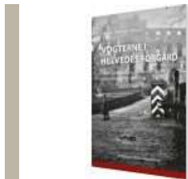
VOGTERNE I HELVEDES FORGÅRD