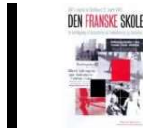
DEN FRANSKE SKOLE & TAVSHED BLEV MIN SANG