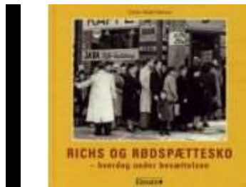
RICHS OG RØDSPÆTTESKO