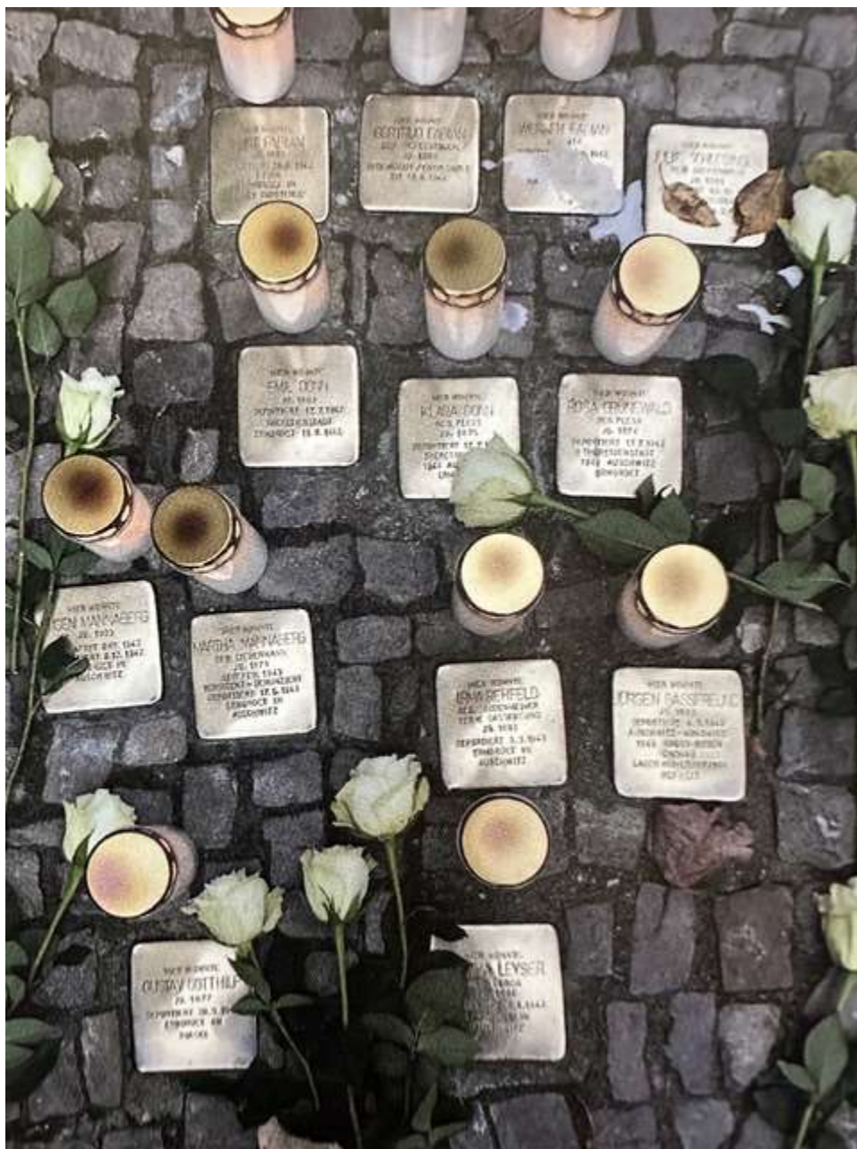
Op til den 9. november, der er årsdagen for Krystalnatten i 1938, er der tradition for at pudse snublesten i Berlin. I Berlin ligger der overordentligt mange sten, og antallet vokser hele tiden. Der kan være års ventetid på at få sat nye sten.

Et menneske er ikke glemt, før dets navn er glemt. Ordene er den tyske kunstner Gunter Demnigs. Han fik ideen til snublestenen i 1992 og de første Stolpersteine blev lagt i Köln i 1995. Antallet steg hurtigt, og nu ligger der mere end 116.000 snublesten i Europa. I Danmark har dygtige mennesker heldigvis kæmpet for, at vi herhjemme også ærer og husker ofrene for tyskernes barbari. Siden 2019 har den danske snublesten-organisation været i gang med at sætte sten. Med så mange sten sat, er det verdens største decentrale kunstværk. Ideen stammede fra et Talmud-citat om at mindes det enkelte offer, det konkrete menneske, der havde et helt og komplet liv, lige indtil forfølgelse og mord abrupt gjorde en ende på det.