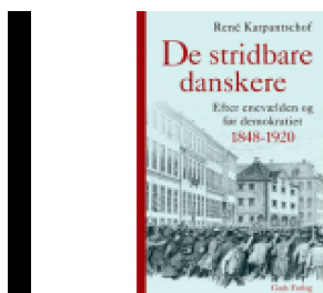
DE STRIDBARE DANSKERE