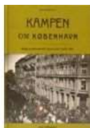
KAMPEN OM KØBENHAVN