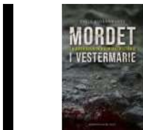
MORDET I VESTERMARIE