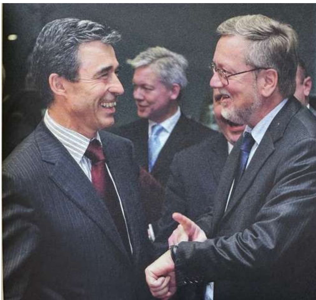
Anders Fogh Rasmussen og Per Stig Møller havde et godt samarbejde

ingenmandsmand mellem Spanien og Marokko i Gibraltarstrædet. Marokko oprettede med ét en militærbase på øen. Dog, efter hurtig indgriben politisk og med spansk militærs hjælp, faldt der ro over Persilleøen igen. De kraftige oversvømmelser af specielt Tyskland fjernede meget naturligt fokus fra EU og udvidelse. Meget spændende og informativ læsning om hele formandsskabet og løsningen af problemerne med at optage et delt Cypern i unionen. Bogens sider om formandsskab af EU og andre store emner, set fra det historiske "chefkontor", er uhyre interessant læsning. Under det danske formandsskab filmede DR til en udsendelse, der hed "Fogh bag facaden". Udsendelsen skabte flere konflikter. Den ene var, at visse (ikke oplyste) kræfter i Udenrigsministeriet følte sig tilsidesat og nedvurderet. Det andet var, at mange mente, at Fogh var for hård ved Per Stig Møller. Med andre ord, at Fogh ikke behandlede Per Stig Møller godt. Det kom bag på både Fogh og Per Stig, som ikke havde set den hektiske arbejdsform som et problem. Fogh er ikke bange for at medtage den slags (for ham) negative og konfliktskabende passager fra sin tid i rampelyset. Fra en valgkamp havde Nyrup i øvrigt revet Foghs bog fra 1993 i stykker, side for side. Fogh byttede bogen med et smil og bemærkningen, at her havde Nyrup så en ny bog. Den ødelagte bog fik Fogh solgt på auktion som kunst, og den indbragte over 22.000. Pengene gik ubeskåret til hjælp til udsatte.