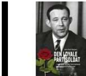
DEN LOYALE PARTISOLDAT