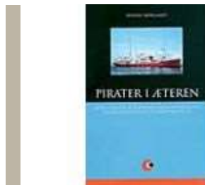
PIRATER I ÆTEREN