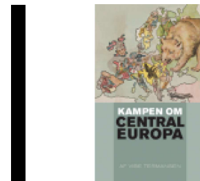
KAMPEN OM CENTRALEUROPA