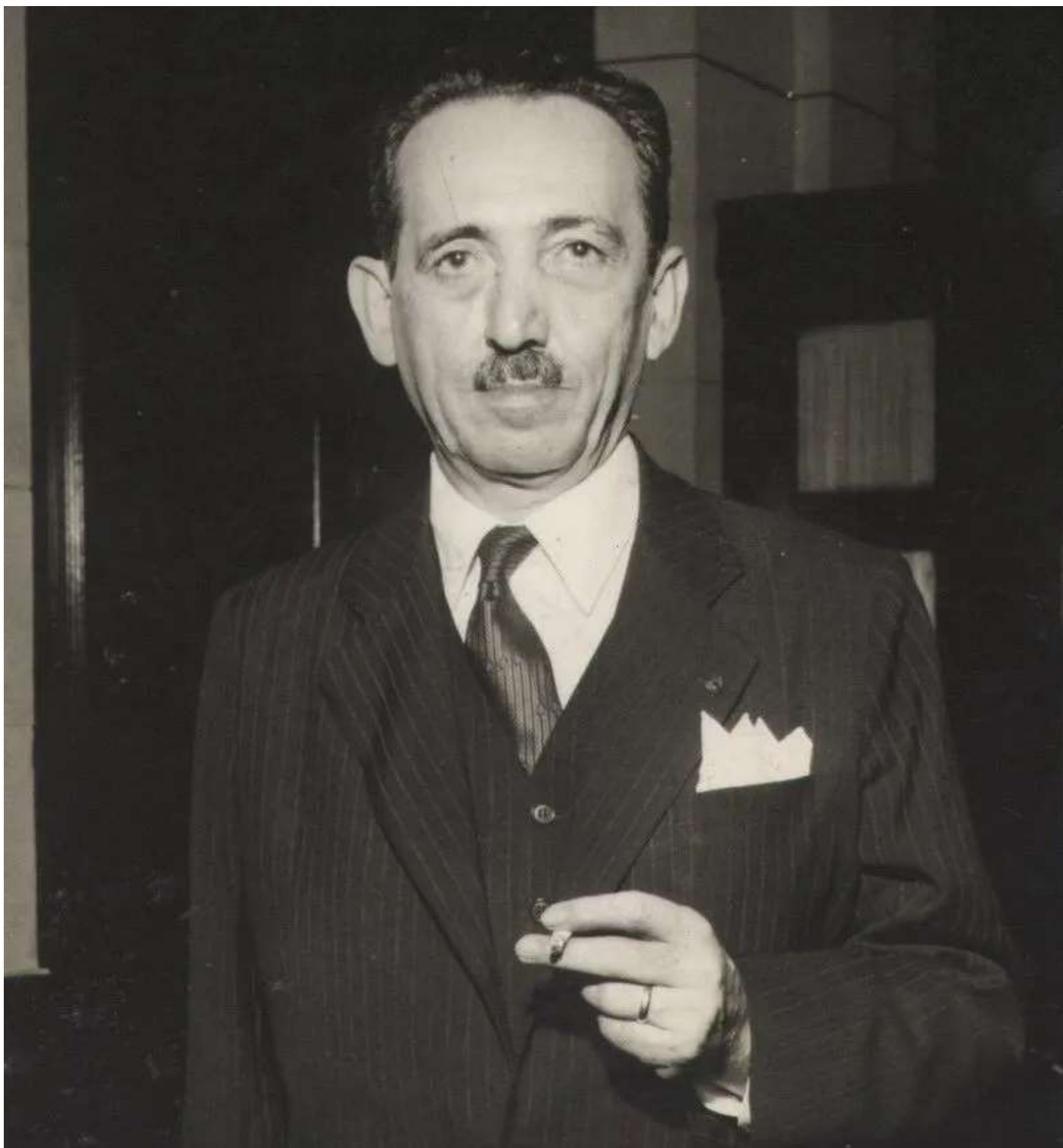
Plinio Salgado.