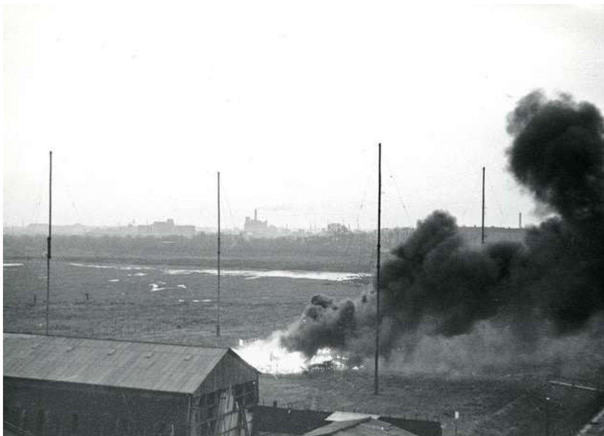
Støjsenderen på Amager Fælled brænder efter sabotage 10. december 1944

Bogen beskriver også stikkerangreb. Flere fra aktionsgruppen i P.5. blev stukket. I december 1944 gik man i aktion mod en støjsender på Amager, som blev ødelagt. Den gik op i røg. Det var et lyspunkt i en tid, hvor man havde folk siddende i Vestre Fængsel, i Frøslev og i Tyskland.