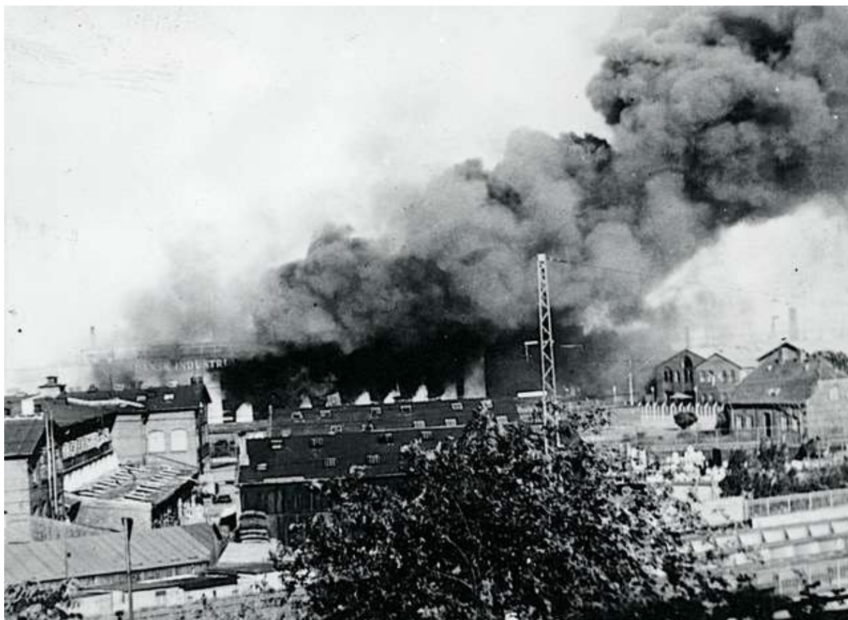
Riffelsyndikatet brænder efter omfattende sabotage

Det vil være alt for omfattende at beskrive alle kompagniets aktioner, men nogle skal nævnes. Med begrænset bevæbning, udrustning og andet, som en "hær" kunne gøre brug af, var det langt mere enkle virkemidler, de havde at kæmpe med. Så meget desto større er respekten for deres kamp. Det gjaldt "besøget" på Syrefabrikken i Kastrup på Amager. Med ladcykler og en enkelt gasgenerator drevet lille lastbil blev aktionen kamufleret som en flytning.