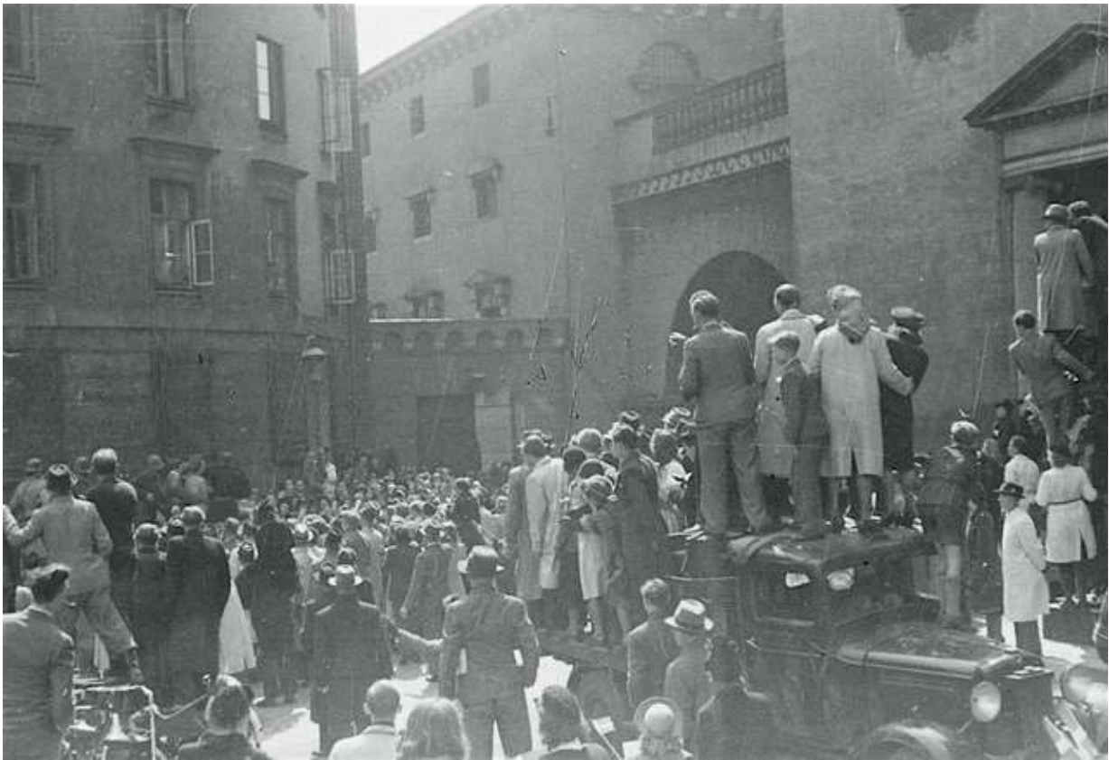
Arresterede og frihedskæmpere