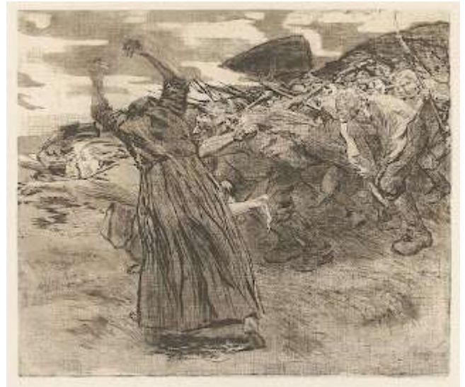
Käthe Kollwitz: Blad 5 "Udbrud" fra serien "Bondekrigen" 1902/03.