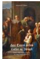
► HANS TAUSEN MELLEM LUTHER OG ZWINGLI

( https://www.historie-online.dk/boger/anmeldelser-5-5/kirke-og-religion/oem-kloster )