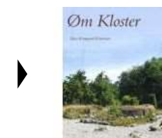
► ØM KLOSTER

( https://www.historie-online.dk/boger/anmeldelser-5-5/kirke-og-religion/oem-kloster )