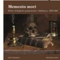
► MEMENTO MORI

( https://www.historie-online.dk/boger/anmeldelser-5-5/15-1600-arene-renaessancen-33/hans-tausen-mellem-luther-og-zwingli )