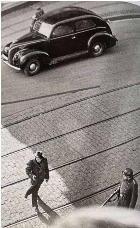
Fra Frihedsmuseet. Antagelig en Gestapomand som krydser vejen