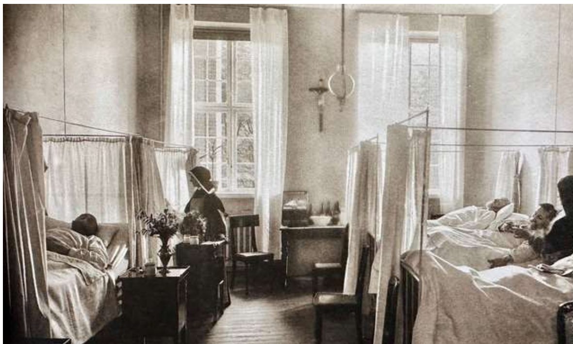
Fællestue på Sankt Josephs Hospital ca. år 1900. Det var nytænkning med privatlivsgardiner dengang

København i 1856. Forfatteren tager allerede læseren med ind i historien i bogen. Meget fascinerende at lære om, hvordan kvinderne blev søstre og hvilken uddannelse, de fik. Han skriver også om den kølige modtagelse, den katolske orden fik i København, og hvordan søstrene med stor omsorg og flid i arbejdet blev anerkendt i befolkningen.