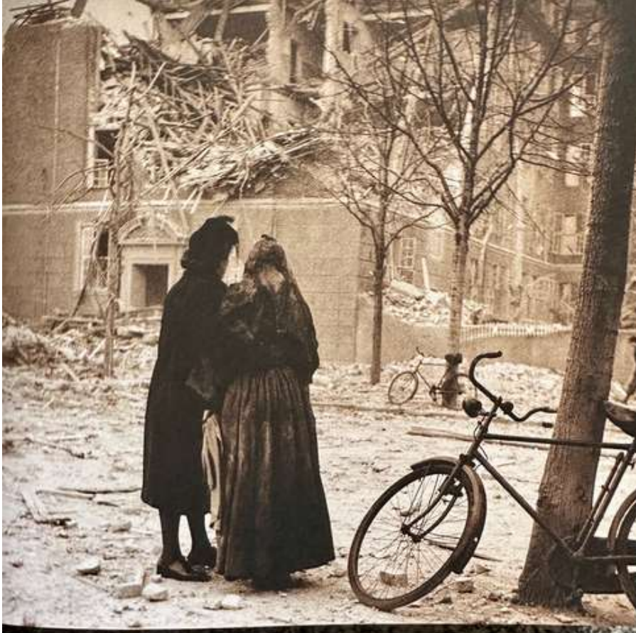
Otte søstre og 86 børn omkom da den franske skole på Frederiksberg blev fejlbombet 21. marts 1945

I Fredericia startede det også med et lille hospital i 1879 med kun 16 senge. I 1885 byggede de nyt, for så i 1930 at bygge et stort tre-etagers hospital med plads til 110 senge. Tyskerne beslaglagde hospitalet i 1943 til lazaret, og efter krigen kom det i drift igen indtil 1949. I Randers var der folkefest, da grundstenen blev lagt til Sankt Josephs Hospital. Den flotte bygning findes endnu, mens søstrene indstillede hospitalsarbejdet i 1946. Igen var det mangel på nye søstre, der lå til grund. I Randers bliver søstre tilkaldt for at hjælpe med undervisning. Det var den katolske præst, som kontaktede søstrene i København. Nu gentog historien sig, for også i Randers havde lægerne svært ved at få sygeplejersker nok. Det gik så fra lille klinik til stort kompetent hospital, som stod klar i 1903. I Horsens var søstrene også repræsenteret og lige sådan i Esbjerg, hvor modstanden fra byrådet og en del borgere var modstandere af at "de skulle holde deres indtog i byen". Det kom til at gå anderledes end de ville. Hospitalet blev bygget, og det var særdeles populært. Søstrene drev hospitalet helt frem til 2002, og i dag bor byens skattecenter i bygningerne.