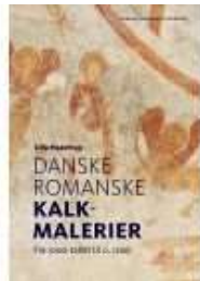
▶ DANSKE ROMANSKE KALKMALERIER

( https://www.historie-online.dk/boger/anmeldelser-5-5/kirke-og-religion/hans-tausen-mellem-luther-og-zwingli )