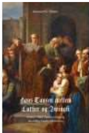
▶ HANS TAUSEN MELLEMLUTHER OG ZWINGLI

( https://www.historie-online.dk/boger/anmeldelser-5-5/kirke-og-religion/hans-tausen-mellem-luther-og-zwingli )