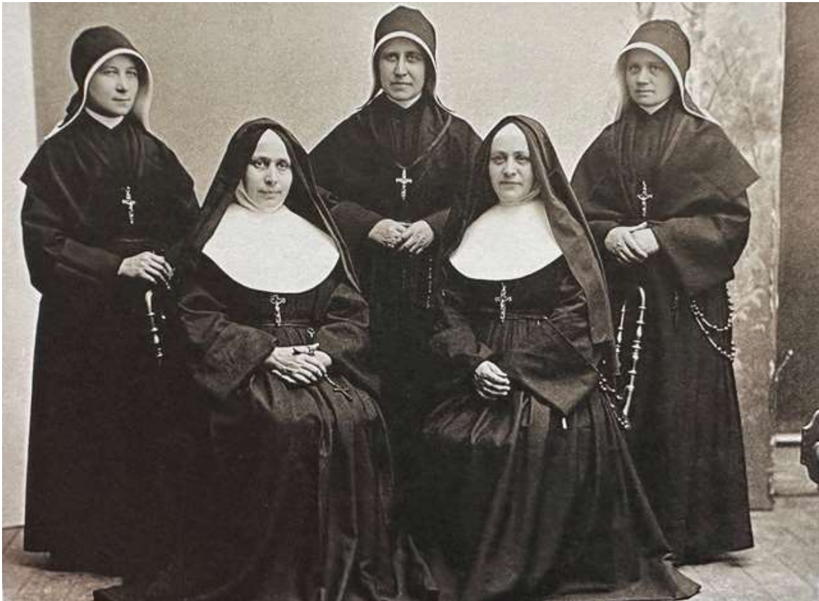
Sankt Joseph Søstre i Horsens i 1900

Det var imponerende at læse kapitlerne om søstrenes arbejde i byerne, men sandelig også på Island og på Færøerne. Der kom også andre søstre til andet end Sankt Joseph Søstre. Den Guddommelige Kærligheds Søstre eller Skolesøstre drev skoler i Horsens, Kolding og i Silkeborg. Det var ikke mindst fordi, Bismarck begyndte at undertrykke den katolske kirke i Tyskland.