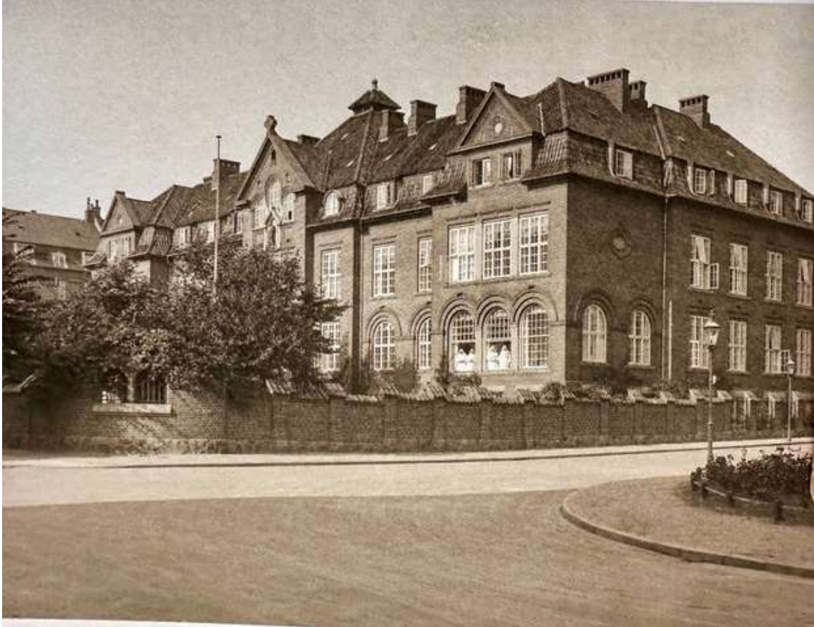
Sankt Joseph Hospital i Aarhus fra 1907. Mange mente det var et af de smukkeste blandt de mange hospitaler, søstrene fik opført

Det var imponerende at læse kapitlerne om søstrenes arbejde i byerne, men sandelig også på Island og på Færøerne. Der kom også andre søstre til andet end Sankt Joseph Søstre. Den Guddommelige Kærligheds Søstre eller Skolesøstre drev skoler i Horsens, Kolding og i Silkeborg. Det var ikke mindst fordi, Bismarck begyndte at undertrykke den katolske kirke i Tyskland.