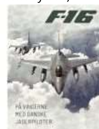
F-16 PÅ VINGERNE MED DANSKE JAGERPILOT

( https://www.historie-online.dk/boger/f-16-paa-vingerne-med-danske-jagerpiloter )