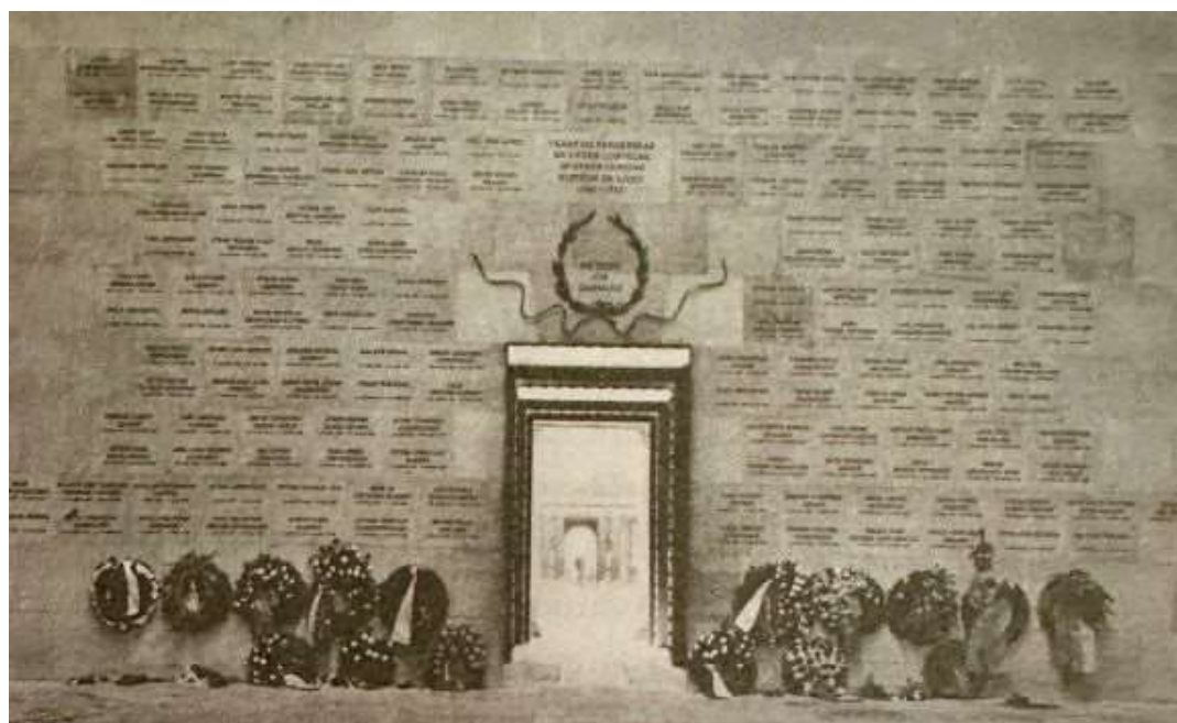
En stor væg i Mindegården i hjertet af Københavns Politigård er helliget alle de omkomne betjente under Aktion Möwe samt de politifolk, der blev dræbt under modstandsarbejde eller som følge af tysk terror

År efter var statistikkerne fortsat dyster læsning. Mange politifolk var skadet for livet, og mange havde mistet livet.