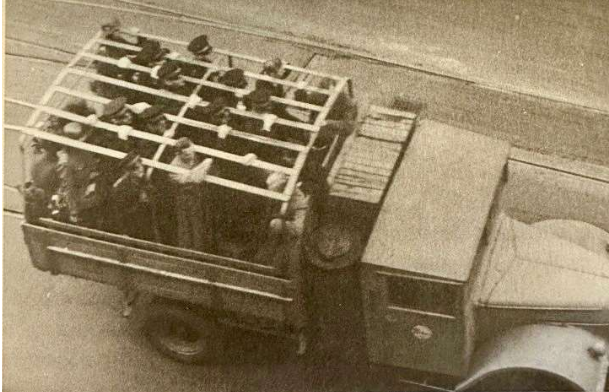
I åbne såkaldte prærievogne køres politifolk til Frihavnen

Den 19. september 1944 præcis kl 11.00 gik aktionen i gang. Luftværnssirenerne blev sat i gang. Med stor grovhed og skarpe våben kastede tyskerne sig ud i opgaven med at internere politifolk. Ved Politigården i København var der opstillet kraftige våben, og alle blev samlet i den runde gård.