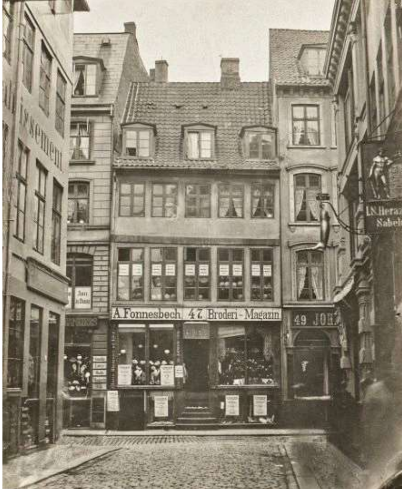
Fønnesbechs Broderi-Magazin i Østergade 47 i København. Senere stormagasin for damer. 1889.

Herhjemme åbnede kvinder broderiforretninger, hvilket de fik lov til efter lov i 1857. Først i 1899 fik gifte kvinder lov til at drive selvstændig forretning, hvilket fordoblede antallet af butikker. I mange forretninger var der kun indehaveren, mens der i andre var ansat hjemmesyersker. En såkaldt brodøse kunne tjene op til 1,30 i timen, og helt ned til 0,16 i timen - hvis erfaring og arbejdshastighed var lavere. Faktisk var dette det første erhverv, hvor kvinder kunne beskæftige sig udenfor hjemmet. En pudsigt ting er, at de to største aktører fra dengang stadig eksisterer og ser ud til at være ganske driftige.