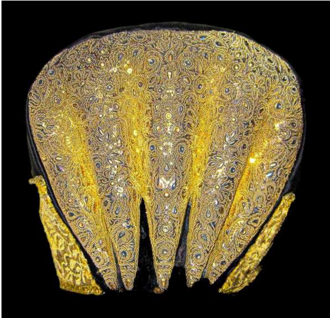
Guldnakkehue i sort silkesatin og guldtråd

Det er muligt bogen vil være til et snævert kvindeligt publikum, men egentlig er det synd. Den generelt historieinteresserede mand kan også få rigtig meget ud af siderne. Alene billederne er imponerende.