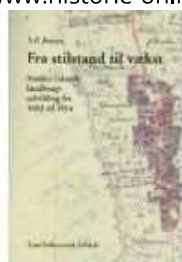
FRA STILSTAND TIL VÆKST

( https://www.historie-online.dk/boger/bondegaaarde-i-skast-herred-1636-1760-1219 ) ( https://www.historie-online.dk/boger/fra-stilstand-til-vaekst )