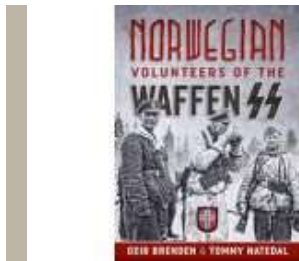
NYT BILLEDVÆRK OM FRIVILLIGE I WAFEN SS