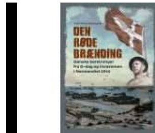
DEN RØDE BRÆNDING