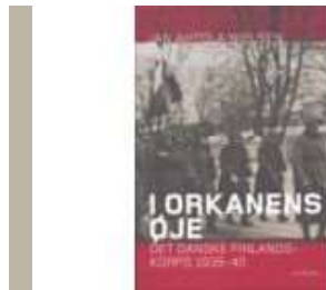
I ORKANENS ØJE