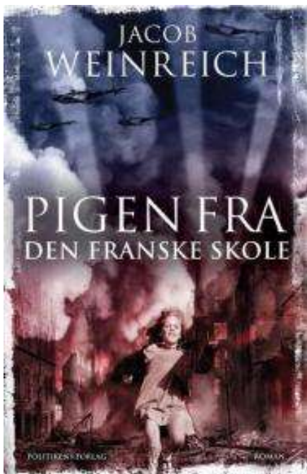
(/boeger/pigen-fra-den-franske-skole) PIGEN FRA DEN FRANSKE SKOLE (/BOEGER/PIGEN-FRA-DEN-FRANSKE-SKOLE) Af Jacob Weinreich