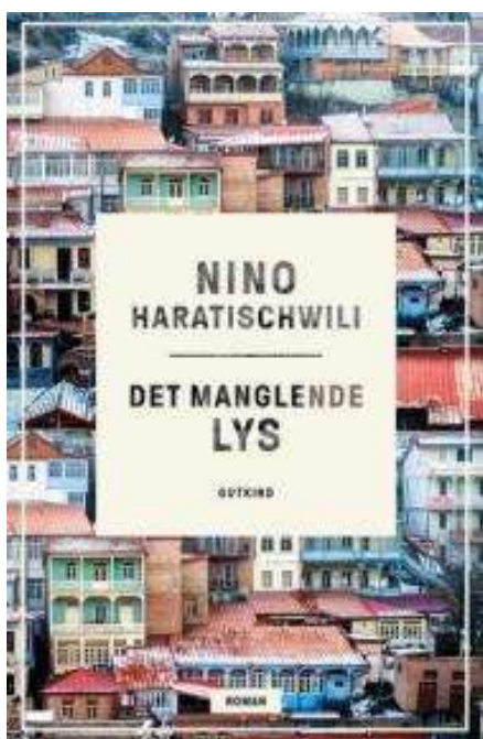
(/boeger/det-manglende-lys-roman) DET MANGLENDE LYS (/BOEGER/DET-MANGLENDE-LYS- ROMAN) Af Nino Haratischwili