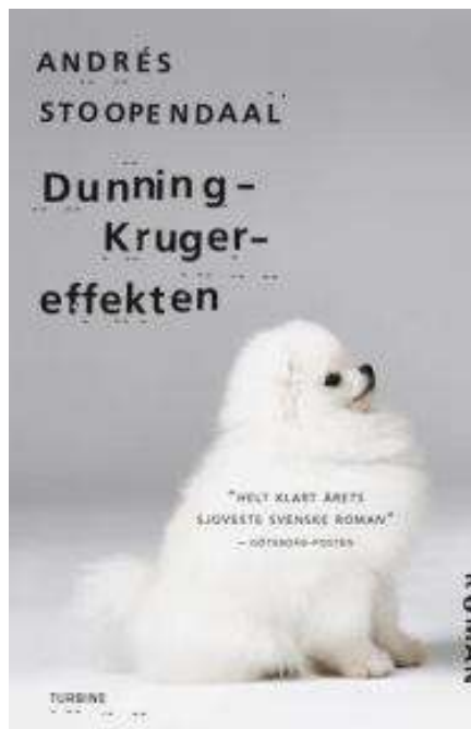
(/boeger/dunning-kruger-effekten) DUNNING-KRUGER-EFFEKTEN (/BOEGER/DUNNING-KRUGER-EFFEKTEN) Af Andrés Stoopendaal (f. 1981)