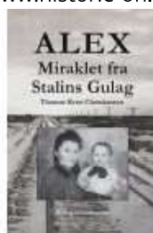
ALEX. MIRAKLET FRA STALINS GULAG

( https://www.historie-online.dk/boger/adolf-hitler-et-politisk-portraet )