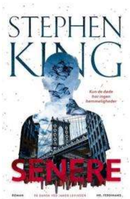
(/boeger/senere) SENERE (/BOEGER/SENERE) Af Stephen King (f. 1947)