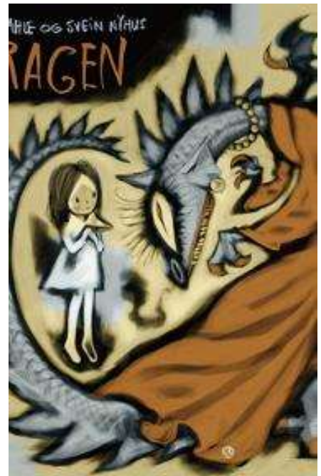
(/boeger/dragen-1) DRAGEN (/BOEGER/DRAGEN-1) Af Gro Dahle