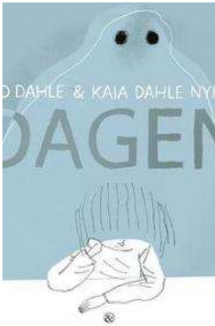
(/boeger/dagen-0) DAGEN (/BOEGER/DAGEN-0) Af Gro Dahle