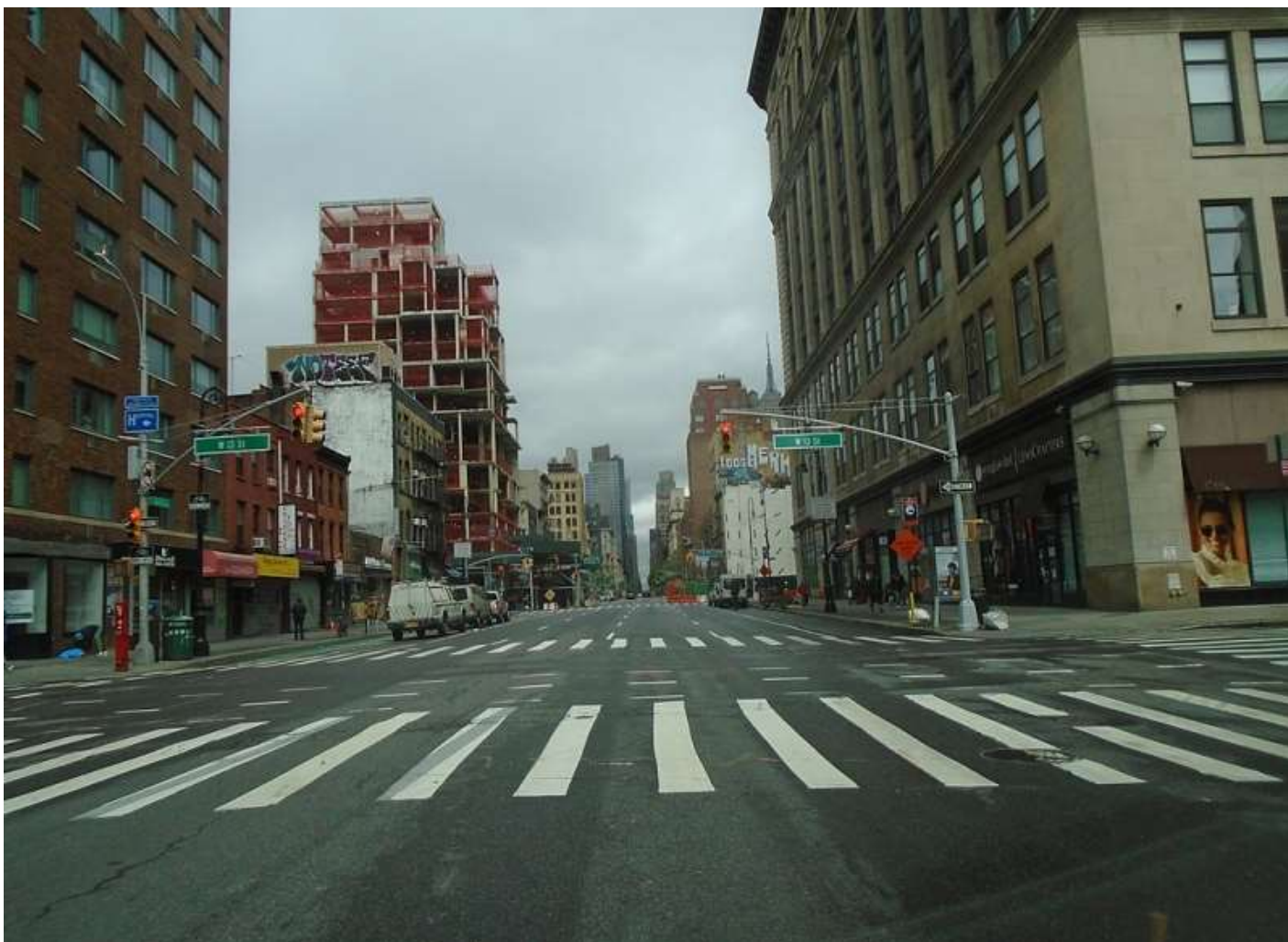
Manhattan i april 2020. Pandemien ramte særligt hårdt i New York City.

En af Fjortens dages historier handler i forlængelse heraf om, hvordan to fjendtlige kaniner (!) lærer at omgås hinanden efter at have gennemlevet et fælles traume, der knytter dem sammen i en slags skæbnefællesskab. Dette synes i nogen grad også at være tilfældet for den forfaldne bygnings beboere. Deres nyfundne fællesskab peger ligeledes på et sært opbyggeligt element ved den globale pandemis totale undtagelsestilstand, idet virussen på sin vis afstedkom en mulighed for et andet nærvær. Et nærvær, som var hævet over den travle hverdags indadskuende gøremål og praktisk-kalkulerende tilgang til verden.