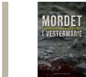
MORDET I VESTERMARIE