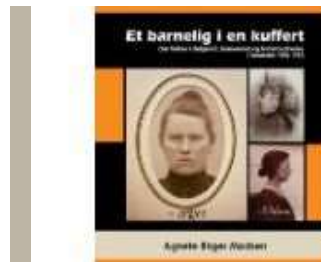
ET BARNELIG I EN KUFFERT