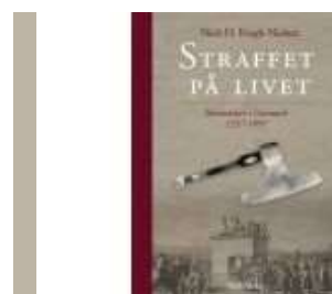
STRAFFET PÅ LIVET