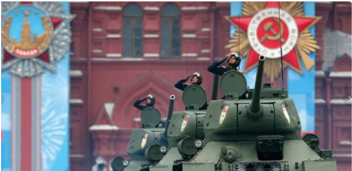
Sejrsparade på Den Røde Plads i Moskva

I Vesten markeres afslutningen på 2. verdenskrig den 8. maj. I Rusland sker det den 9. maj. Forskellen skyldes, at underskriften på kapitulationsdokumenterne i maj 1945 først kom på plads så sent, at tidsforskellen mellem Berlin og Moskva betød, at det nu var blevet ny dag i det daværende USSR.