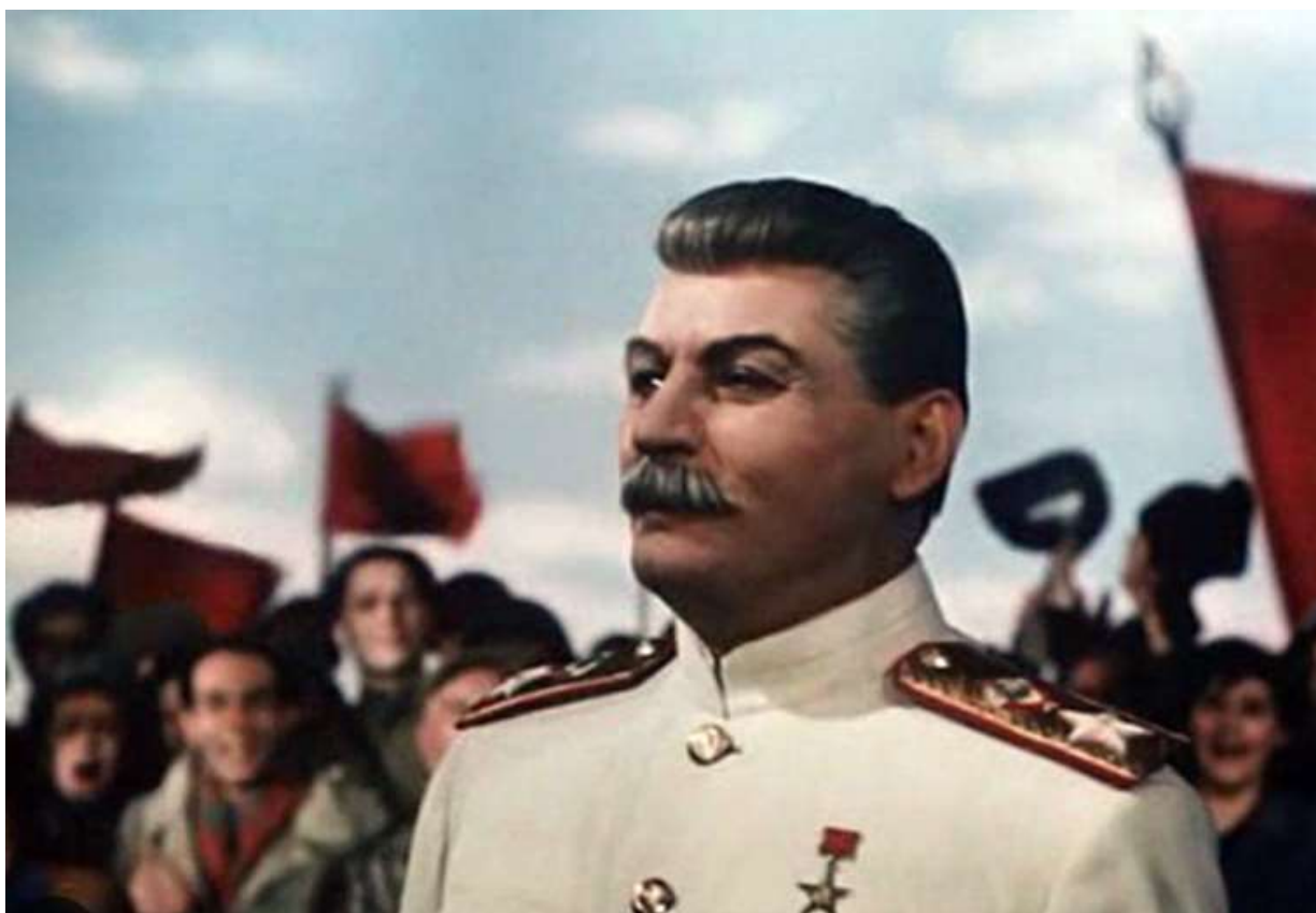
Stalins "yndlings-Stalin" blev spillet af Mikhail Gelovani (1893 – 1956)

I 1949 kom filmen "The Fall of Berlin" (Den engelske oversættelse fra russisk). Det er en heroisk fortælling om kampen mod det nazistiske uhyre. Det er en film i to dele. Her folder propagandaen sig ud for fuld styrke. Mod filmens slutning ankommer selveste Josef Stalin med fly til Berlin. (Stalin var bange for at flyve). Her hyldes han af en aldeles entusiastisk skare – nærmest religiøs. Slutningen af filmen kan ses på YouTube her: https://youtu.be/eVp7Nf6pQnI?si=Bh-wi_AhuHSQQruO . Det omtalte klip begynder 1time og 8 minutter inde.