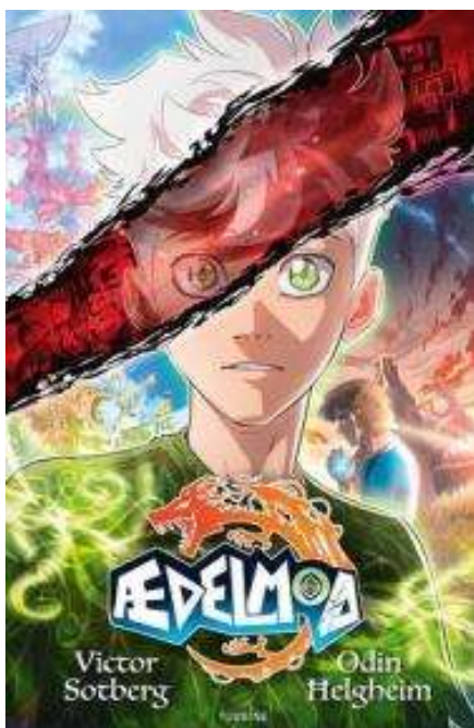
(/boeger/aedelmod) ÆDELMOD (/BOEGER/AEDELMOD) Af Victor Sotberg og Odin Helgheim (III.)