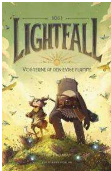
(/boeger/lightfall-vogterne-af-den-evige-flamme) LIGHTFALL - VOGTERNE AF DEN EVIGE FLAMME (/BOEGER/LIGHTFALL-VOGTERNE-AF-DEN-EVIGE-FLAMME) Af Tim Probert