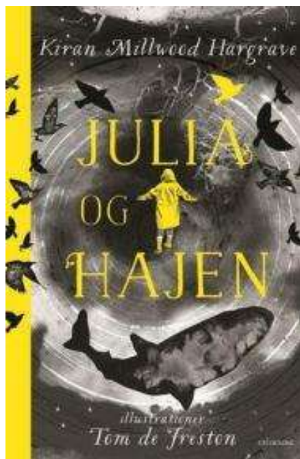
(/boeger/julia-og-hajen) JULIA OG HAJEN (/BOEGER/JULIA-OG-HAJEN) Af Kiran Millwood Hargrave