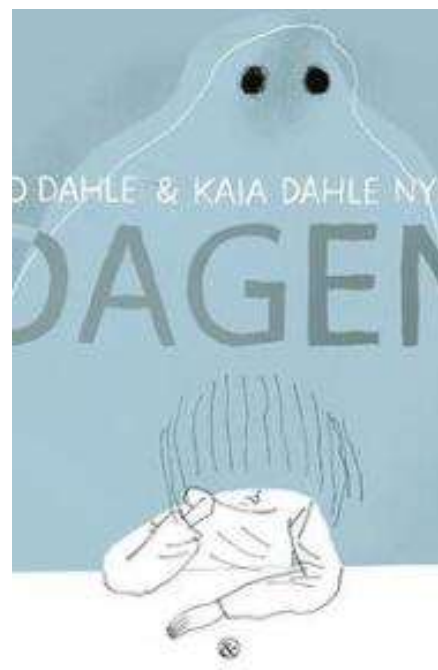
(/boeger/dagen-0) DAGEN (/BOEGER/DAGEN-0) Af Gro Dahle