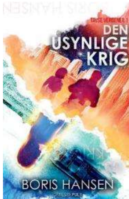
(/boeger/den-usynlige-krig) DEN USYNLIGE KRIG (/BOEGER/DEN-USYNLIGE-KRIG) Af Boris Hansen