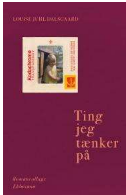
(/boeger/ting-jeg-taenker-paa) TING JEG TÆNKER PÅ (/BOEGER/TING-JEG-TAENKER-PAA) Af Louise Juhl Dalsgaard