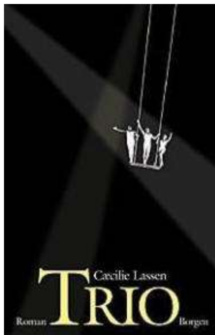
(/boeger/trio) TRIO (/BOEGER/TRIO) Af Cæcilie Lassen (f. 1971)