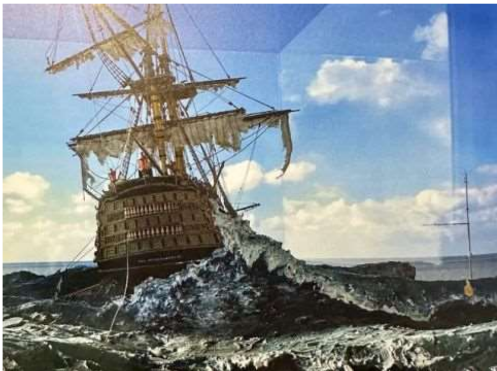
Det engelske skib forliser i Vesterhavets brænding. Et utrolig smukt diorama

kan man så forsøge at forstå skibsforsøret tragedie. Mange andre historier er blevet fortalt med skibsmodeller, og gennem modelskibet kan mange leve sig ind i livet på søen.