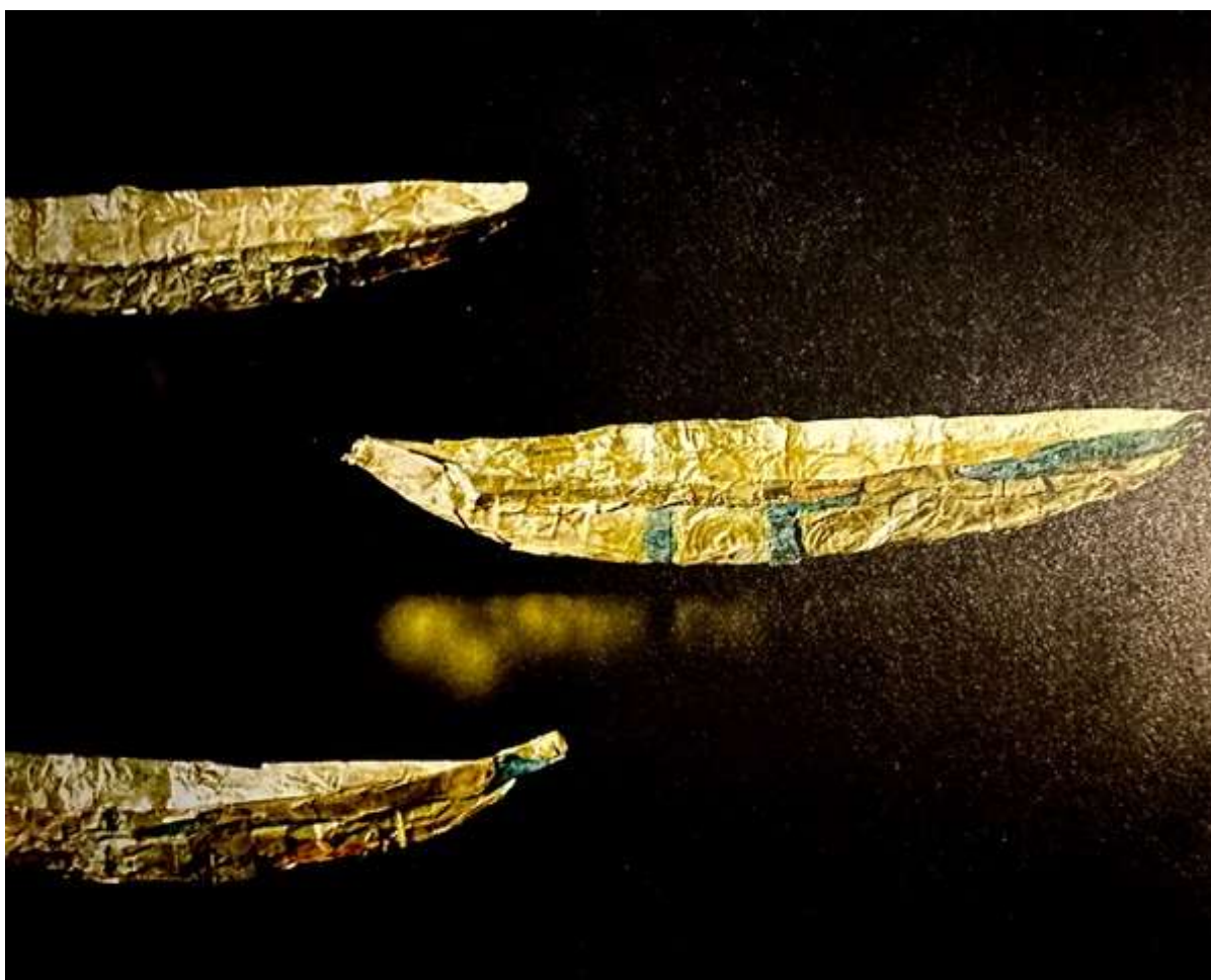
I Nors i Thy fandt man i 1885 hele 100 både af guld, med bronze spanter og svøb

I oldtiden blev der også gjort noget for at bygge modellerne - og bruge dem til noget. I 1885 blev der i landsbyen Nors i Thy fundet 100 både, 10-17 cm lange - i guld. I ægte guld og med fine spanter af nænsomt monteret irgrøn bronze. Som forfatteren beskriver det: "Det er ærlig talt helt vildt".