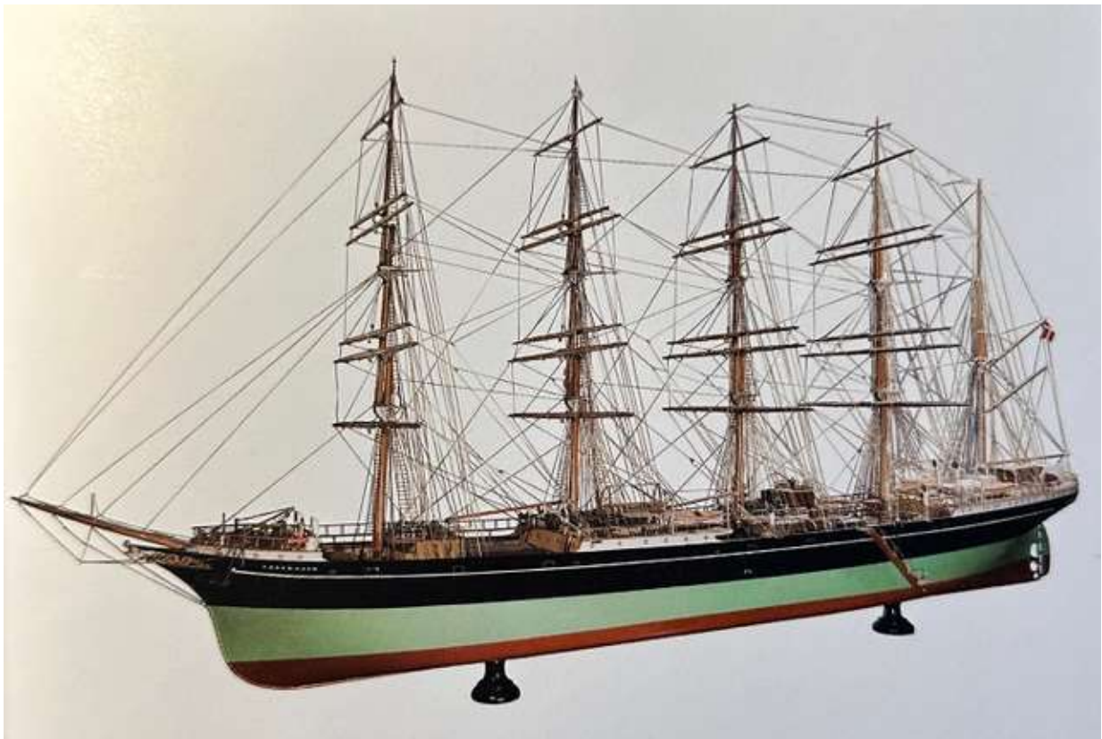
Skoleskibet København forsvandt i 1928 med 59 ombord

Bogen rummer fortællingen og adskillige velvalgte billeder. Et er af den professionelt byggede model, som står på museet. Den slags modeller, som er givet i ordre af rederierne, er meget ofte bevaret i fin stand. Specielt er det ØK's Selandia, som i flere udgaver er med. Den sidste var containerskibet, som havde en navnesøster, Jutlandia. Jeg har selv som shippingmand haft den store glæde at være med på rejser med begge skibe. Dengang, som ansat som en del af operationen af skibene hos ScanDutch, var det sjovt, at naboen på den anden side af Amaliegade også var et stort containerskibsrederi med et hav af containere og lyseblå skibe, der sejlede ud i verden.