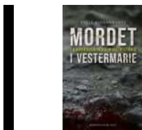
MORDET I VESTERMARIE