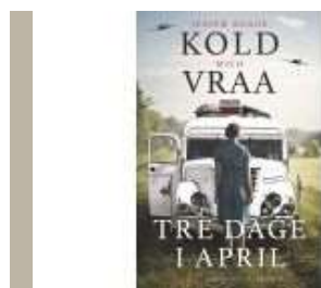
TRE DAGE I APRIL