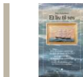
ET LIV TIL SØS