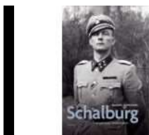
SCHALBURG - EN PATRIOTISK LANDSFORRÆDER